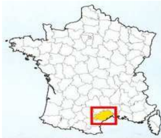
En Languedoc Roussillon