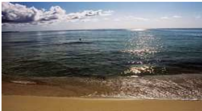
Les plages du Cap d'Agde, Valras, Sérignan.