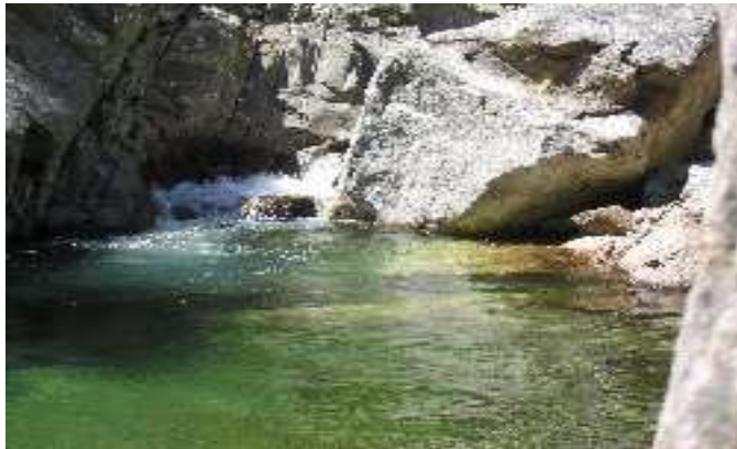
Les baignades dans les gorges d'héric.