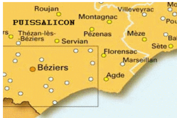
PUISSALICON dans l'Hérault