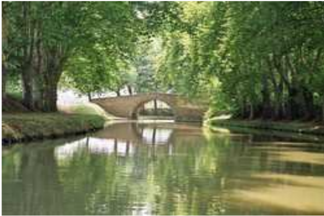
Le canal du midi de Pierre Paul Riquet.