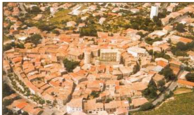
Vue aérienne de PUISSALICON